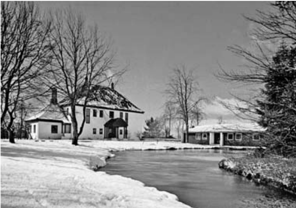
Villa Skjoldnes fungerte utmerket både som internat og undervisningsbygning for jordmorelevnene fra 1972 til 1991.

I følge kongelig resolusjon av 1863 skulle elevene opplæres i vaksinasjon. Det ble også undervist i «skrivning og forstandsøvelse». Praktiske ferdigheter måtte innøves, og de måtte ha kjøkkentjeneste