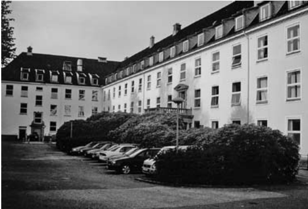
Kvinneklinikken ved Haukeland Sykehus, åpnet 1926. Internat for jordmorelevener var i 4. etasje.

Følgende tall er hentet fra medisinalstatistikken; av 1000 barselkvinner døde: