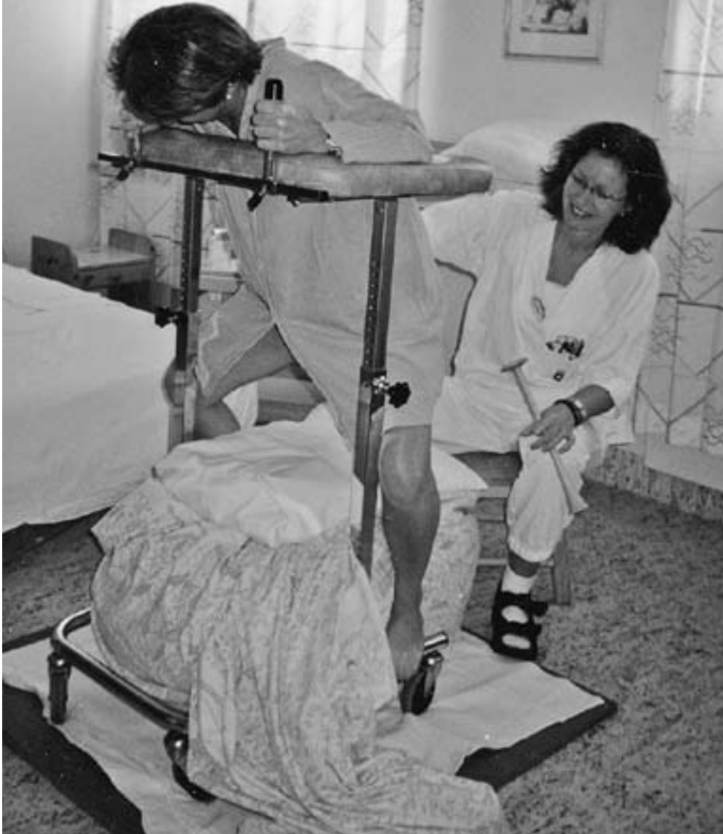
Studentene oppøves til kunnskapsbasert fagutøvelse til beste for fødekvinnen.