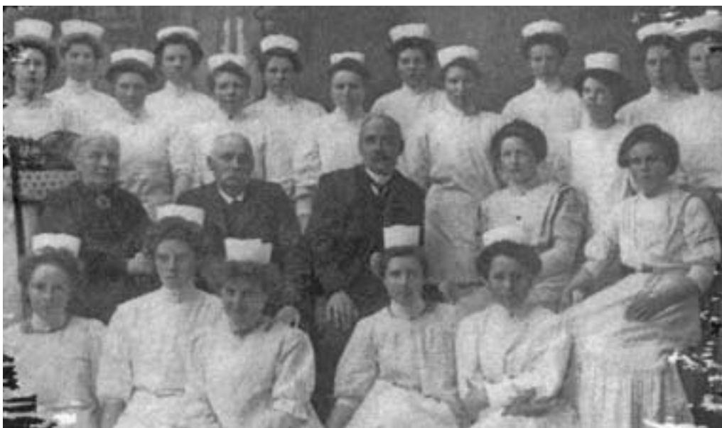
Jordmorelever utdannet ved Bergen Jordmorskole 1910.