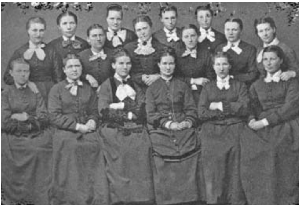
Jordmorelever utdannet ved Bergen Jordmorskole 1877.