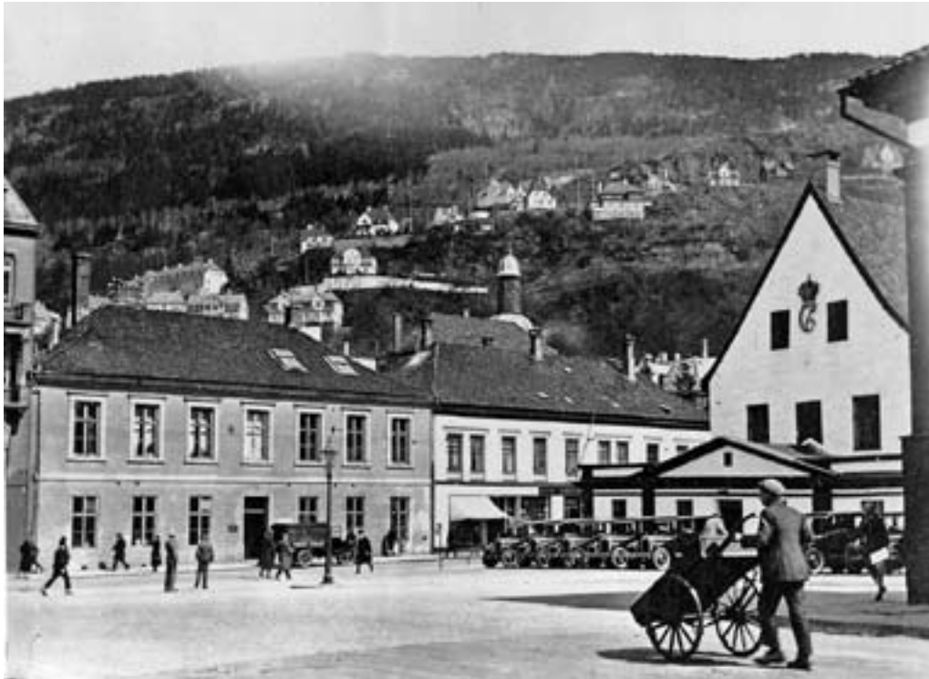
Fødselsstiftelsen på Raadstueplass i Bergen var hjem for jordmorutdanningen fra 1863 til 1926. Foran Gamle Rådhus var det drosjeholdeplass i mellomkrigstiden, men mye av transporten i byen foregikk fremdeles med håndkjerrer.