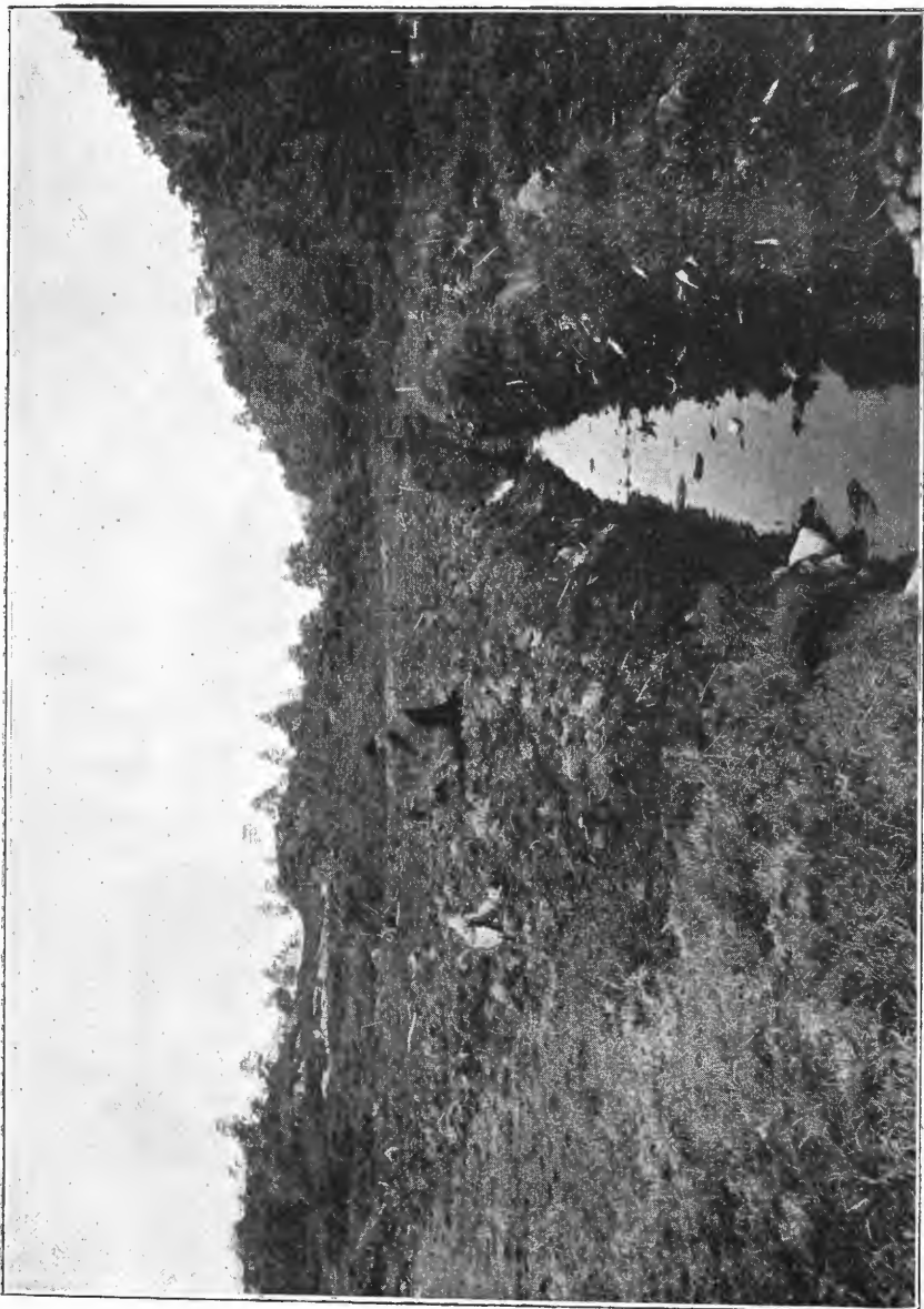
Myr under greftning, Bjøndalen, Asteen.