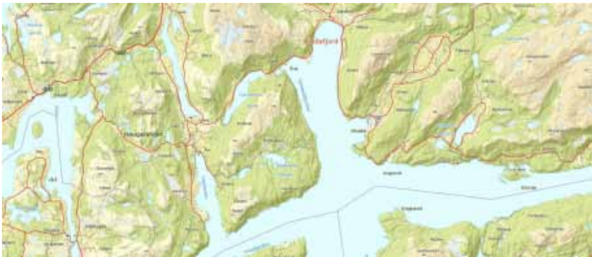
Figur 1 Kart over Sandeidfjorden i Vindafjorden.

Sandeidfjorden er en del av Vindafjorden, og strekker seg ca. 8 km i nordgående retning. Innerst i fjorden har elven Øvstabølva utløp. Vannforekomsten har et areal på 16,56 km 2 (Vann-nett), og dypeste punkt er ca. 300 m. Vanntypen er beskyttet fjord/kyst. Sandeidfjorden har et relativt bredt og dypt utløp til resten av Vindafjorden, og sirkulasjon og vannutskifting antas derfor å være god. Miljøtilstanden i fjorden er ikke tidligere undersøkt.