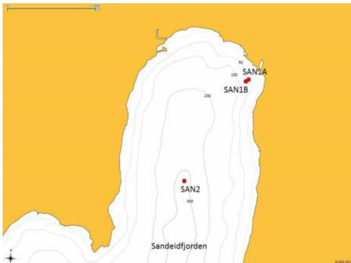
Figur 2 Kart over indre del av Sandeidfjorden, og stasjonenes plassering.