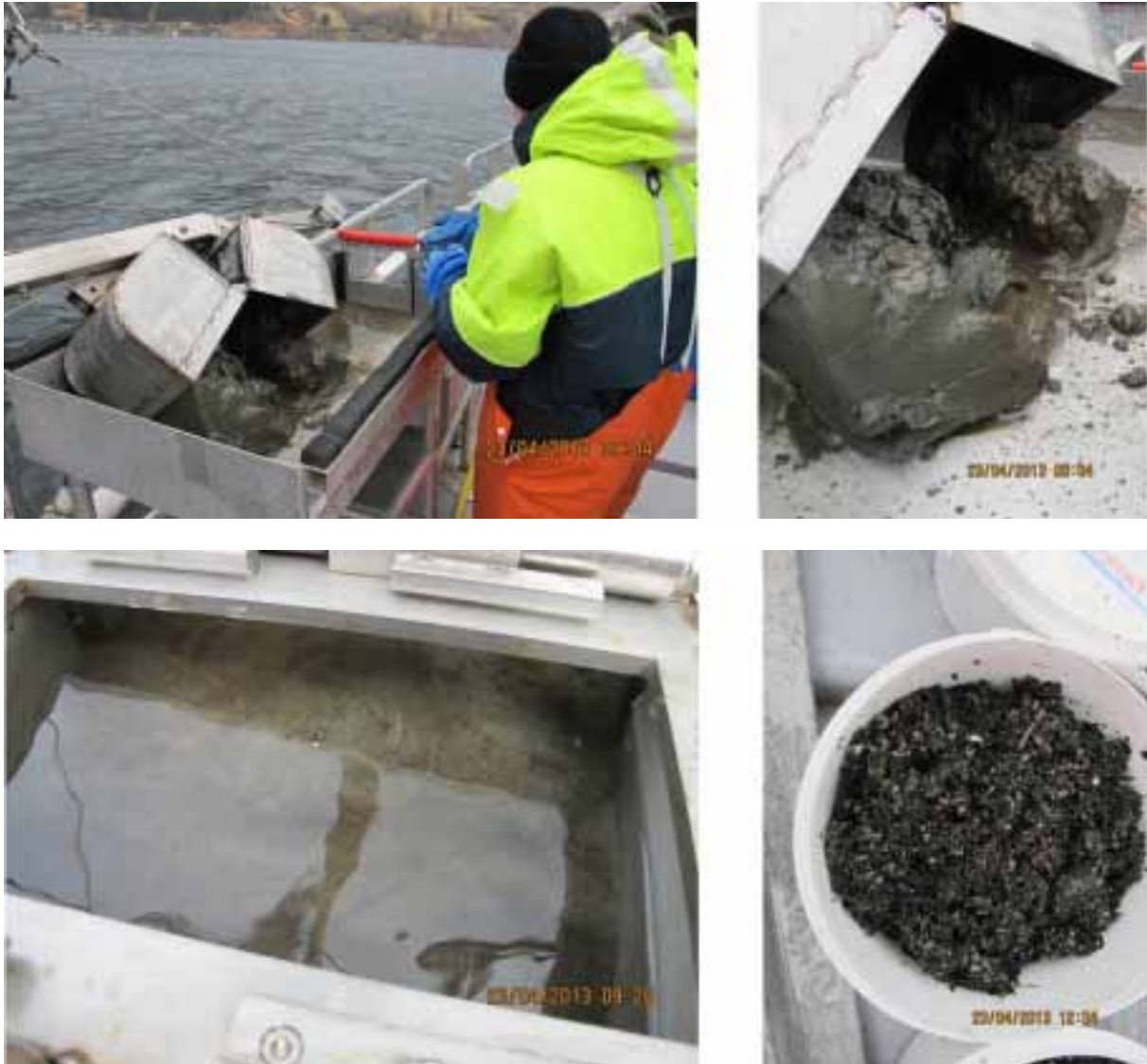
Figur 3 Bilder fra prøvetaking av bløtbunnsfauna. Øverste to bilder og nederst til venstre: prøvetaking av SAN2. Nederst til høyre: sedimentprøve fra SAN1A.