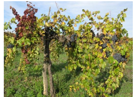
Et gammelt vintre. 72

Ved å begynne med ordene «Jeg er (Ἐγώ εἰμι)» (v.1) viser Jesus at han forstår seg som Gud, ut fra Det Gamle Testamentet (2 Mos 3,14). 73 Vingården er også bilde fra Det Gamle Testamentet, som symboliserer Israel. Israel blir beskrevet som Guds vingård, som skal gi Gud ære. (Sal 80,8-18; Jes 5,1-7; Esek 15,1-18; 17,5-8; 19,10-14). Samtidig er det slående å se at dette vingårdsbildet gjerne blir brukt ved domsavsigelser. Israel var en vingård som bar vill frukt, selv om forholdene var tilrettelagt (Jes 5,2).