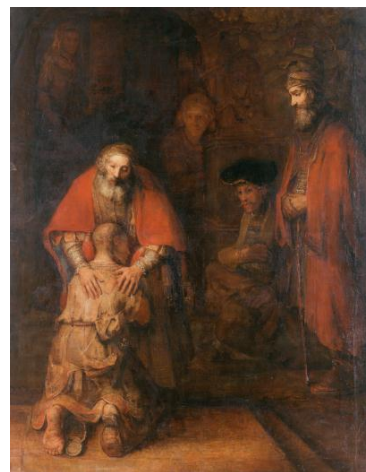
Rembrandt Harmenszoon van Rijns "Den fortapte sønns hjemkomst", malt i 1669. 98

Nouwen tar videre utgangspunkt i maleriet av Rembrandt om den bortkomne sønn og beskriver hvordan han ble fascinert av å se på dette maleriet. 99 Dette bildet bruker han som bakgrunn for beskrivelsen av sin egen reise gjennom disse tre personene: Den yngste sønnen, den eldste sønnen og til slutt faren. Han bringer også frem historier fra Rembrandt sitt eget liv for å illustrere forandringen som har skjedd i Rembrandt mellom bildet han malte av den yngste sønnen som selvportrett, til bildet av den fortapte sønns hjemkomst. 100