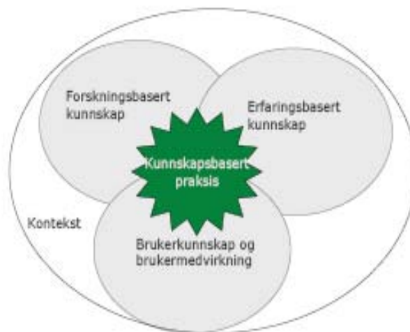
Figur 1: Modell for kunnskapsbasert praksis

Kunnskapsbasert praksis er praktiske handlinger basert på metoder og teknikker som har dokumentert effekt. Kunnskapsbasert praksis utvikles i en gitt kontekst med en forankring i ulike kunnskapskilder. Kunnskapskildene som ligger til grunn for utvikling av kunnskapsbasert praksis er brukererfaringer, de profesjonelles erfaringer og resultater fra nyere forskning med dokumentert effekt. Utøvelse av en kunnskapsbasert praksis forutsetter at de profesjonelle arbeider systematisk og holder seg orienterte og oppdaterte på nyere forskning innen sitt område (Nortvedt m. fl. 2007). I figur 1 vises forholdet mellom de ulike kunnskapskildene i kunnskapsbasert praksis.