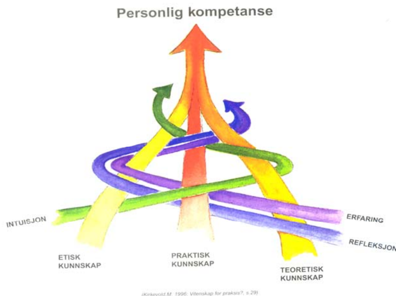
Figur 1 Personlig kompetanse (Kirkevold 1996:29)

personlig, ved at faglige og personlige handlinger utføres på bakgrunn av verdimeslige hensyn (ibid.).