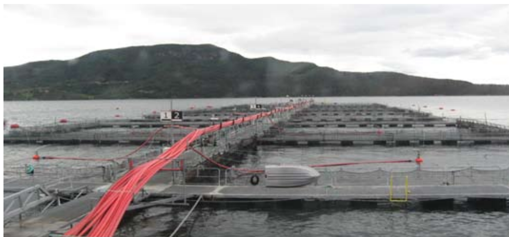
Ekspertsystemet samler inn miljø- og atferdsdata fra hele vannsøylen og overfører informasjonen til en sentral database.