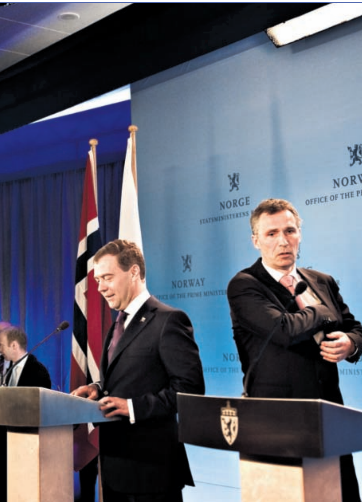
Minister Jens Stoltenberg da avtalen om delelinjen i Barentshavet ble undertegnet tidligere i år. I dag er det denne havområdet.